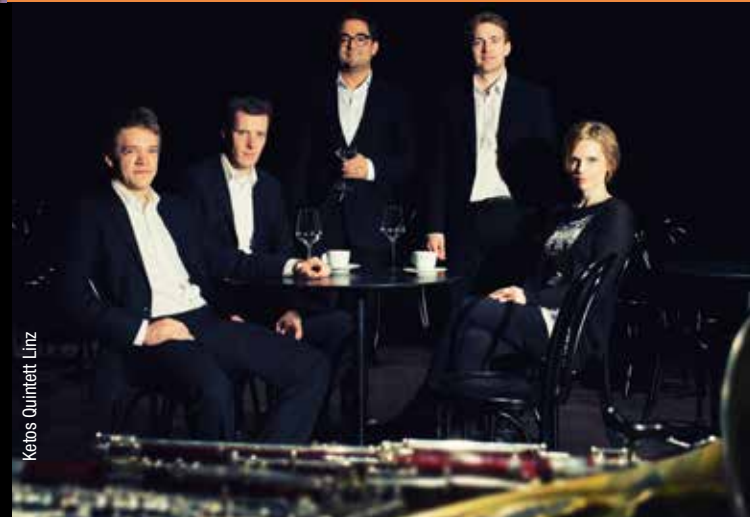
Ketos Quintett Linz

Information und Kartenverkauf: www.museumliaunig.at Tel. 04356/211 15 sowie im Museum Liaunig