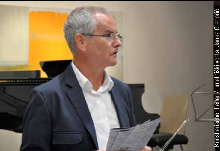
Künstlerischer Leiter / umetniški vodja: Janez Gregorič